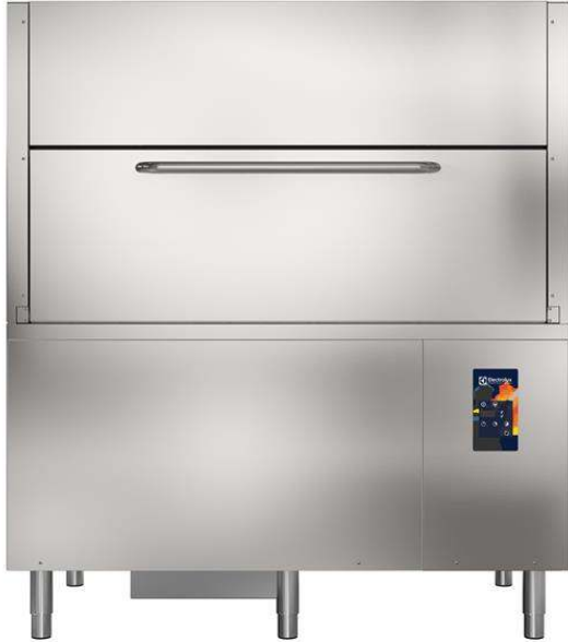
Varusteiden pesukone pelastuslaitoksille, poistopumppu + pesuaineannostelija